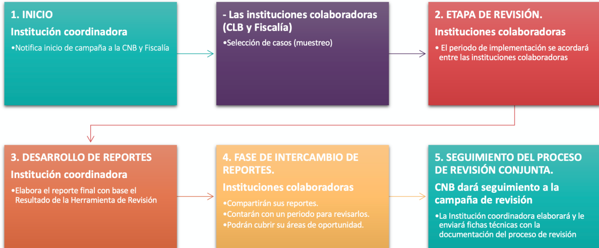
Imagen 5. Flujo del proceso de revisión semestral

Derivado del mecanismo descrito en el apartado anterior, se plantea el siguiente flujo de proceso.